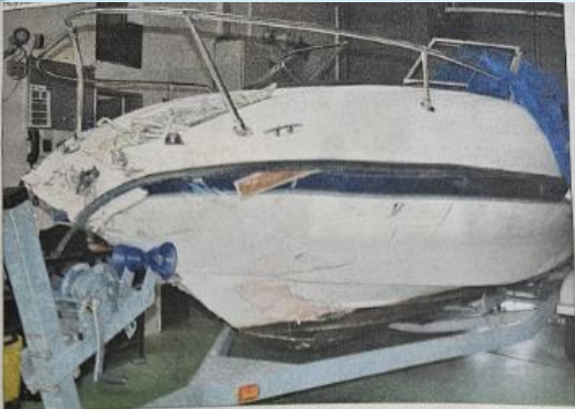
Le bateau à moteur, qui allait trop vite, a heurté des enrochements, puis est passé par-dessus la digue et a terminé sa trajectoire dans le Grand Canal, près de Noville.